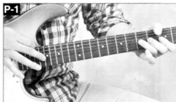
▲右手はフレット真上を叩いたら素早く離す!

アンディ十八番のミュート音(X印の音符)を含む上昇リック。タブ譜ではX印の音を4弦上に記したが、