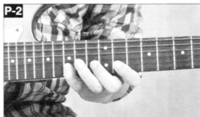
▲[11 f・13 f・15 f]を[人差指・中指・小指]で。