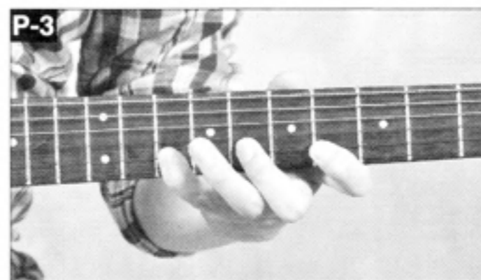
▲P-2のフィンガリングを5フレット分平行移動。