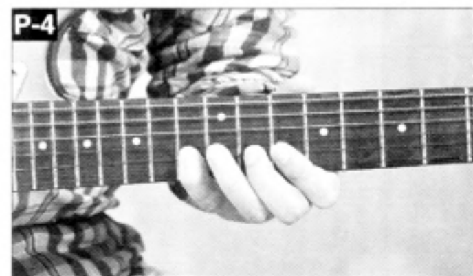
▲[10 f・11 f・13 f]を[人差指・中指・小指]で。

特に4弦に拘る必要はない。リズムをキープするためのガイドのようなつもりで、ミュート音をピッキングするのがやりやすいかと思う。また、フレーズのリズムが1拍半単位となっているので、本来のビートを見失わないようにも気をつけること。